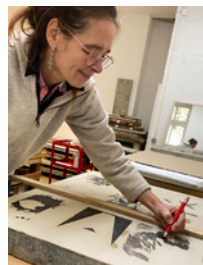
Übertragen der Skizzen auf den Druckstein